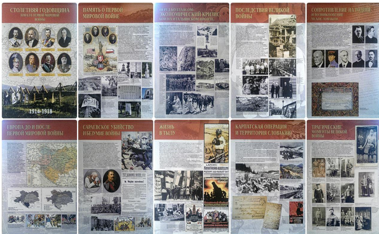
Рисунок 5. Фотоплакаты з виставки, присвяченої 100-річчю Першої світової війни, організованої Генеральним консульством Словаччини в Ужгороді.

Використання новітніх технологій можна поєднувати із напрацюваннями попередніх років. Зокрема, з використанням манекенів, котрі, зокрема, застосовуються в ансамблевих експозиціях. У 1960–1980-і рр. вони зазнали критики за зайвий «натуралізм», але в останні десятиліття використання манекенів знову повернулося в практику музеєзнавства.