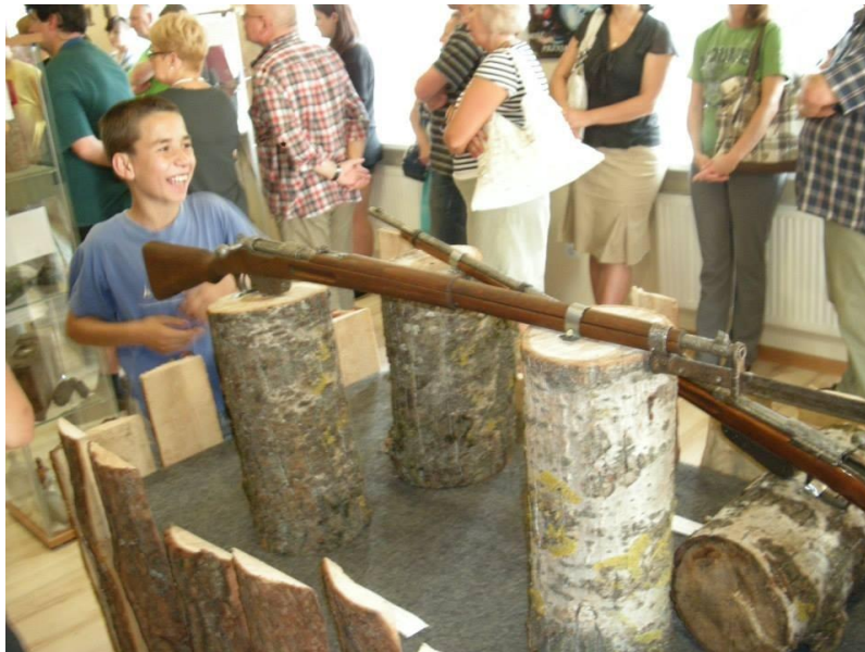
Рисунок 10. Фрагмент експозиції «Залу традиції» «Польського дому» в с. Костюхівка (Волинська обл.)

Раритетні експонати доцільно демонструвати у традиційних, звичних горизонтальних вітринах. Тим більше, що нині виробники пропонують якнайрізноманітніші їх форми. Гнучко налаштовувати систему експонування цінних експонатів і рідкісних історичних документів дозволяють модульні вітрини.