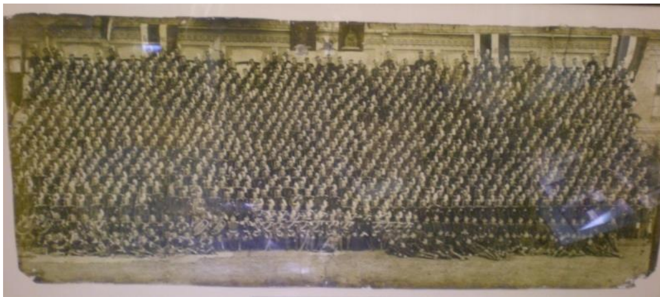
Рисунок 16. Офіційне полкове фото з експозиції Національного військово-історичного музею України.

Важливе значення для формування образного ладу музейної експозиції мають предмети мистецтва. У музейних експозиціях використовуються всі види образотворчих джерел. Оскільки вони створені спеціально для розгляду, звернені до глядача, експозиція сприяє виконанню притаманної їм функції. У творах образотворчого мистецтва, як і у фотографіях, відображаються різні сторони суспільного життя, різноманітні життєві ситуації, вони дають наочне уявлення про середовище, в якому протікає діяльність людини, конкретизують історичний процес, персоніфікують його створенням портретів людей, як видатних, так і рядових.