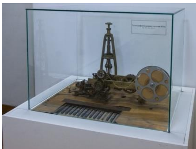
Рисунок 9. Апарат Юза часів Першої світової війни у вітрині повного огляду Національного музею історії України.

Широкі можливості для розміщення експонатів надають вітрини повного огляду. Найчастіше їх конструкція передбачає безрамне скління. Низка ж музеїв (здебільшого – недержавних), взагалі відмовилась від скління, здійснивши оригінальне закріплення експонатів. Втім, таким чином можна експонувати предмети, що не становлять істотної наукової та художньої цінності.