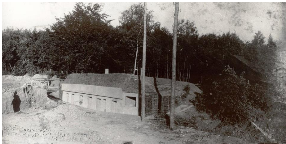
Рисунок 1. Сховище бункерного типу «Бригади Больцано» (с. Бурканів) – основа запланованого музейного комплексу січових стрільців.

До речі, цікавим було б відтворити і російські польові укріплення. Відтворення в натурі і у тому ж масштабі макетів австрійських та російських бліндажів і окопів сприятиме чуттєвому, наочному сприйняттю цього важливого елементу військової інфраструктури та порівнянню ставлення військового керівництва ворогуючих держав до життя своїх солдатів і офіцерів.