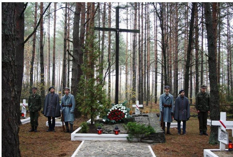
Рисунок 2. Почесна варта польських харцерів біля центрального поховання на польському військовому меморіалі поблизу с. Костюхнівка.

За схожою концепцією побудовано і меморіально-музейний комплекс с. Костюхнівка Волинської області. На самому кладовищі поховані польські легіонери, загиблі у дні Брусіловського прориву, та знайдені останки вояків інших частин ворогуючих армій.