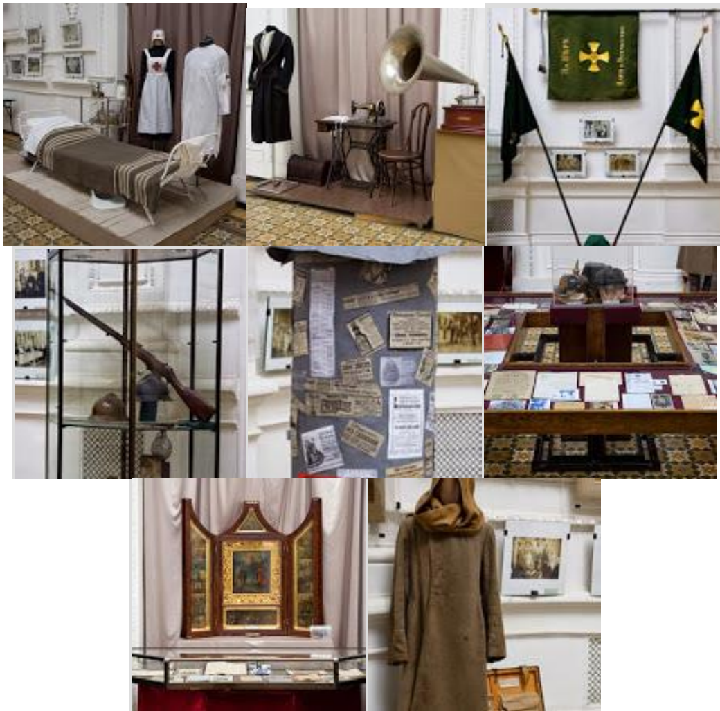
Рисунок 3. Стенди виставки "Про війну, любов та віру...", присвяченої 100-й річниці початку Першої світової війни. м. Дніпропетровськ.

Основу теорії сучасного експозиційного мистецтва складають останні досягнення різних суспільних наук та їх загальне прагнення до цілісного світосприйняття на відміну від колишньої диференціації та ізоляціонізму. В минулому експозиції часто будувались за принципом ілюстративності, тобто підбору експонатів як ілюстрацій до цитат чи заздалегідь визначених, часто схематичних положень. При недостатній увазі до оригіналів, в побудові більшості експозицій панував не стільки показ експонатів, а скільки розповідь, текст – цитата.