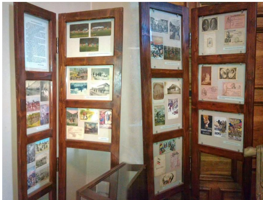
Рисунок 8. Пристінні вітрини з експозиції, присвяченої Першій світовій війні в Ужгородському музеї.

у популярності тієї чи іншої експозиції. Як приклад такого підходу до різнопланового оформлення залів, можна навести розмаїту кольорову гамму, використану при оформленні залів Національного музею історії України.