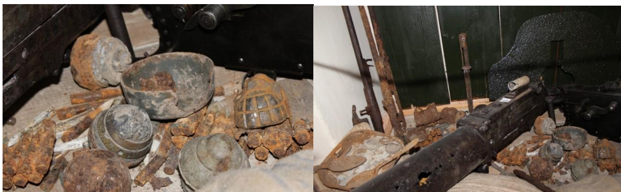
Рисунок 6. Як приклад такого свідомого нагромадження експонатів можна вказати експонування зброї і боєприпасів часів Першої світової війни у Волинському регіональному музеї українського війська та військової техніки.

ж таки, це потребує відповідного текстового пояснення, особливо, за відсутності екскурсовода.