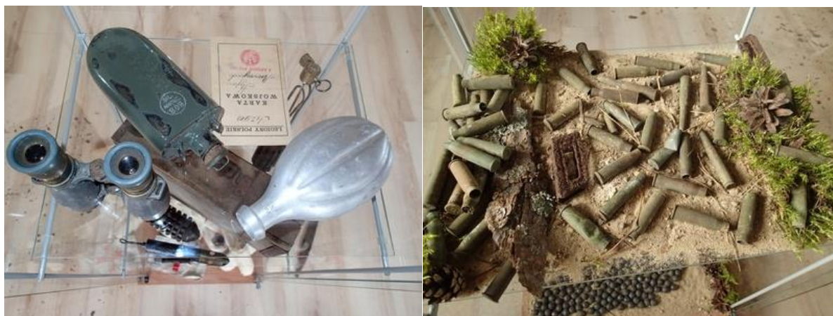
Рисунок 7. Вертикальні вітрини «Залу традицій» «Польського дому» в с. Костюхівка (Волинська обл.).

Такими привабливими якостями володіють вертикальні вітрини. Більше того, конструктори подбали про те, щоб не тільки гранично ефективно використовувати площі залів, а й зберегти привабливість і елегантність їх інтер'єрів.