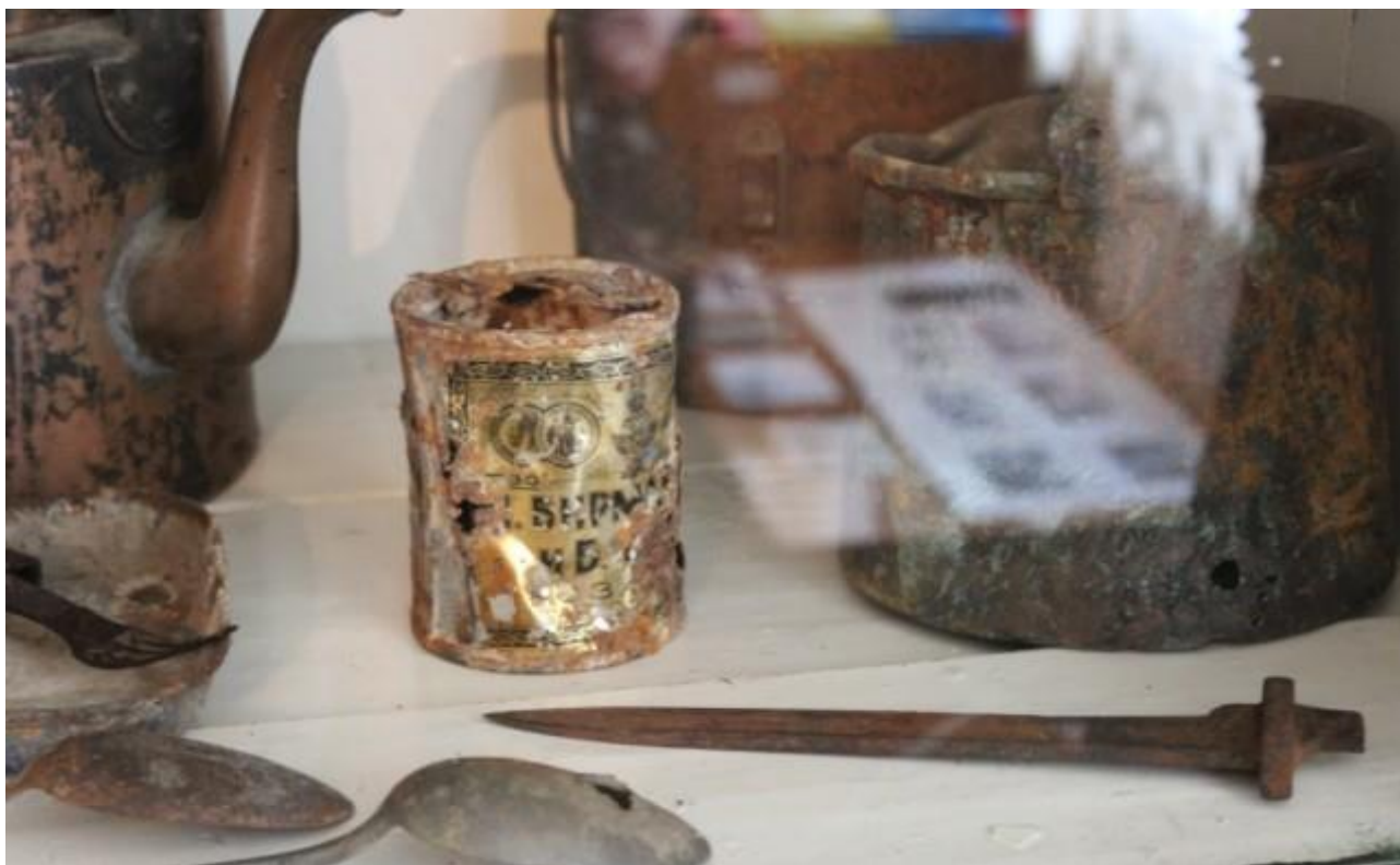
Рисунок 11. Археологічний матеріал в залах, присвячених Першій світовій війні у Волинському регіональному музеї українського війська та військової техніки.

При наявності археологічного матеріалу в музейній експозиції більш повно і яскраво демонструються усі сторони побуту, культури та інших сторін життя. Саме вони дозволяють відвідувачу з особливою гостротою відчувати повсякдення війни. Особливо, якщо археологічні матеріали експонуються окремими комплексами в поєднанні із письмовими та іншими матеріалами.