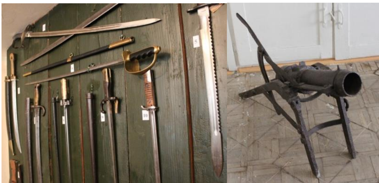
Рисунок 13. Експонати Волинського регіонального музею українського війська та військової техніки, що демонструють еволюцію засобів вбивства. Справа – унікальний польовий міномет 1916 р. (З фондів Торчинського народного краєзнавчого музею).

Водночас, в процесі такого експонування, доцільним було б кожен експонат супроводжувати поясненням, підкреслювати еволюцію людської думки у винайденні нових засобів вбивства, наголошуючи про цьому на деструктивності війни взагалі.