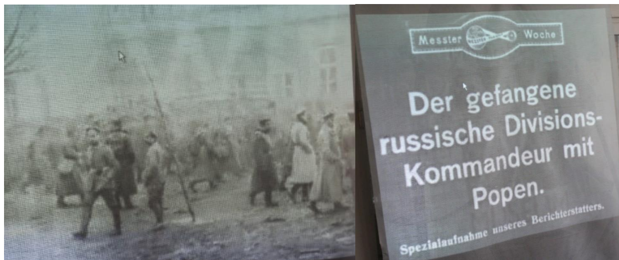
Рисунок 4. Кадри з відеохроніки м.Луцька, зняті австро-угорськими військовими кінооператорами, продемонстровані у Волинському регіональному музеї українського війська та військової техніки.

Тож, якщо спочатку експонат «мовчав», то при включенні аудіовізуальних засобів і при відповідній драматургічній інтерпретації була внесена динаміка, і експонат немов би «ожив», розширюючи інформаційний стрій експозиції в цілому.