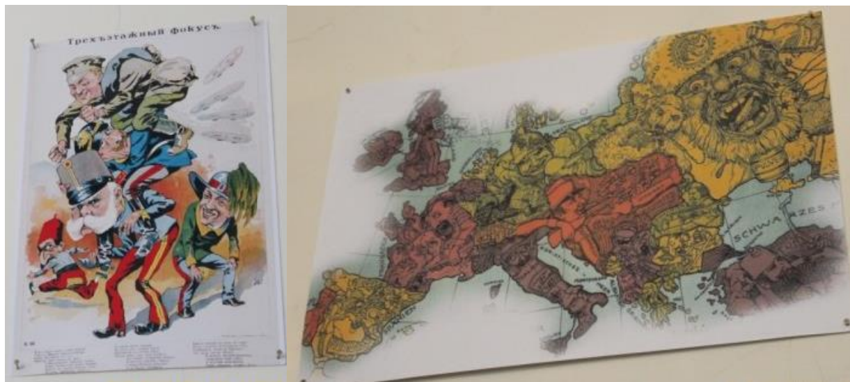
Рисунок 14. Плакати Антанти і Троїстого союзу.

війні, не обходиться без демонстрування плакатів того часу. Досить повна і змістовна колекція таких предметів знаходиться у фондах Національного музею історії України. Окрім, власне, емоційного впливу, вивчення таких плакатів дає змогу під новим кутом зору поглянути на зміни внутрішньої політики ворогуючих держав. Засобами плакату можна ілюструвати і стенди, присвячені загарбницьким планам країн Антанти та Четвертного союзу, пояснення ними своїх експансіоністських устремлінь.