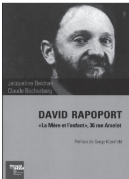
Обкладинка книги « La Mere et l'enfant », 1994 р.