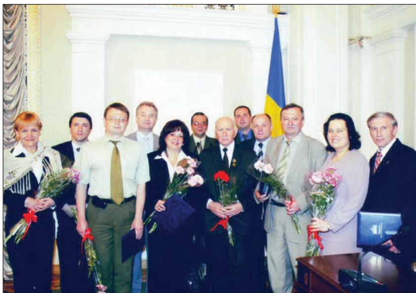
Нагородження краєзнавців Грамотою Верховної Ради України, червень 2005 року