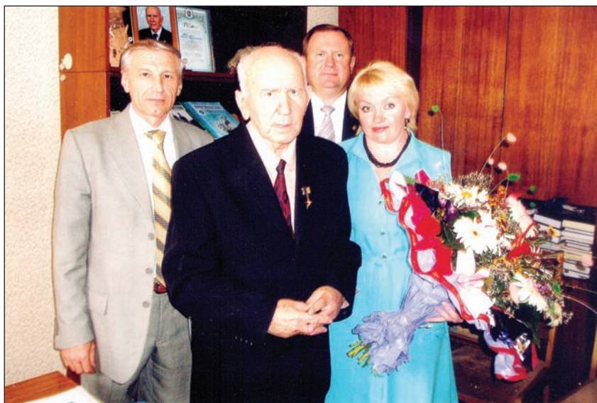
Привітання Вчителя, академіка НАН України П. Т. Тронька з 90-річчям, 12 липня 2005 року