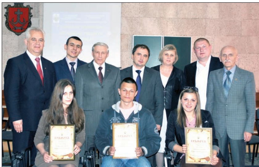
Обласна університетська олімпіада «Я прагну творити майбутнє», квітень 2012 року