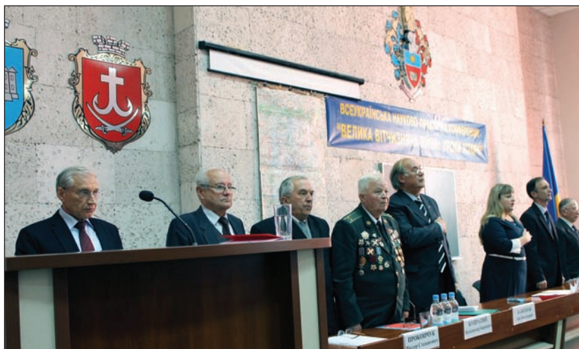
Всеукраїнська науково-практична конференція «Велика Вітчизняна війна: уроки історії», жовтень 2014 року