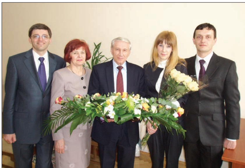
Привітання доньки після захисту кандидатської дисертації у Київському національному університеті імені Тараса Шевченка, березень 2014 року