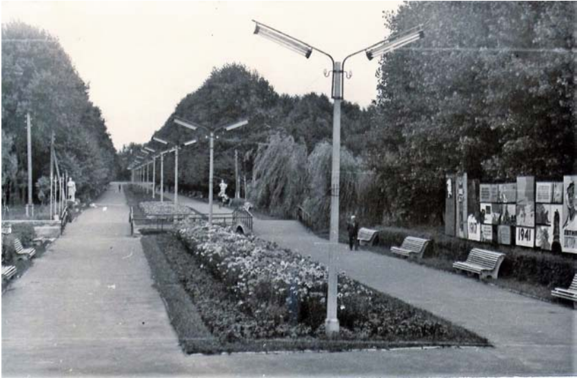
Центральна алея парку, 1968 р.