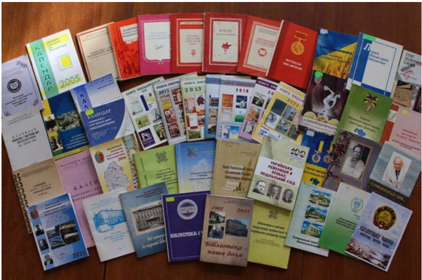
Видання Хмельницької ОУНБ