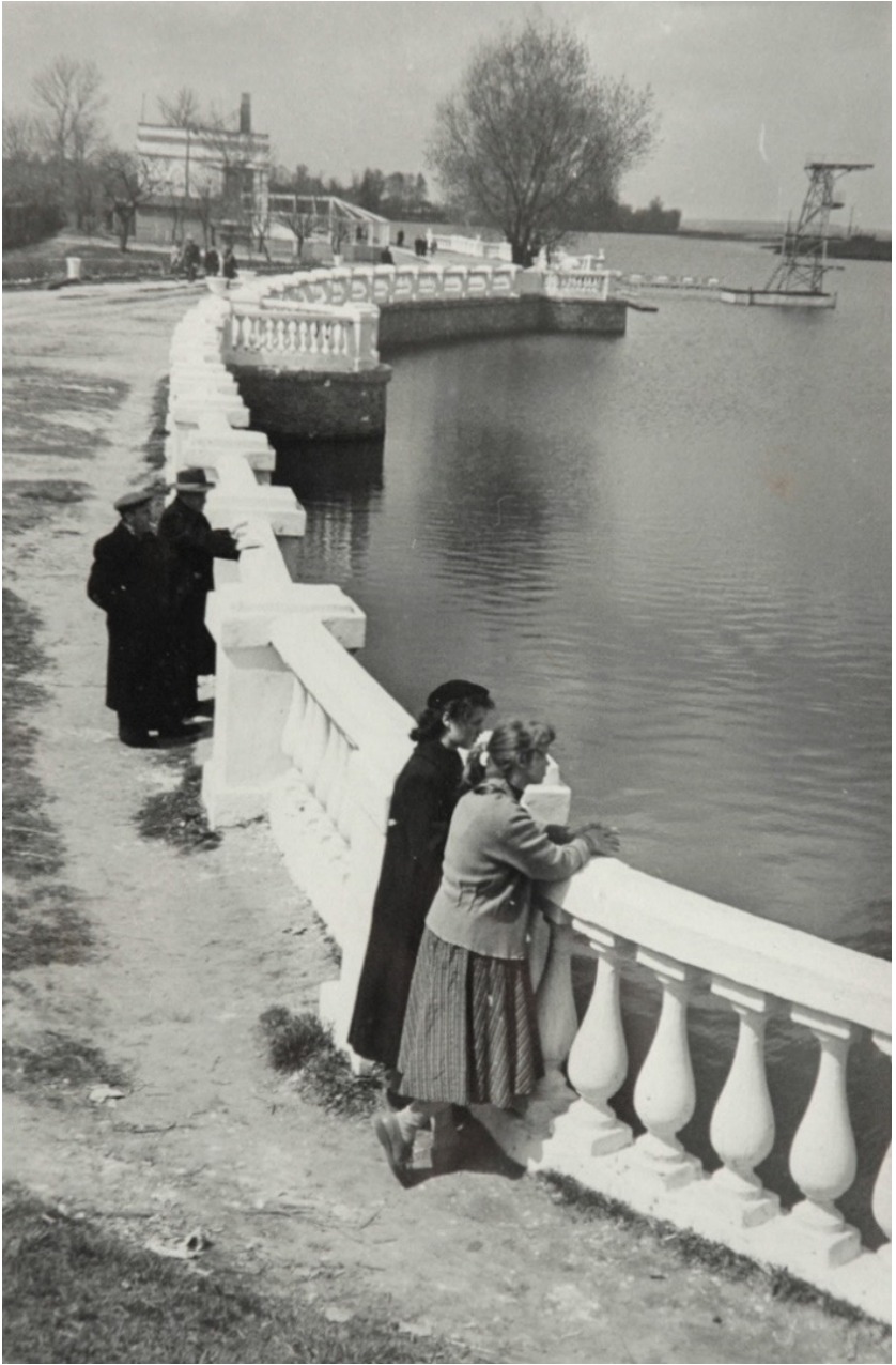
Набережна, початок 1950-х рр.