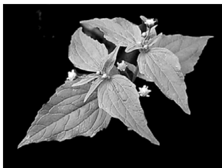
Рис.5. Галінсога дрібноквіткова