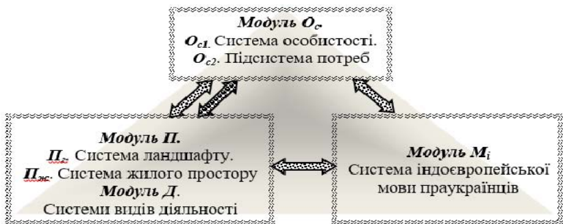
Мал. 1. Модель систем самоідентифікації за ознаками жилого простору та/або видів діяльності