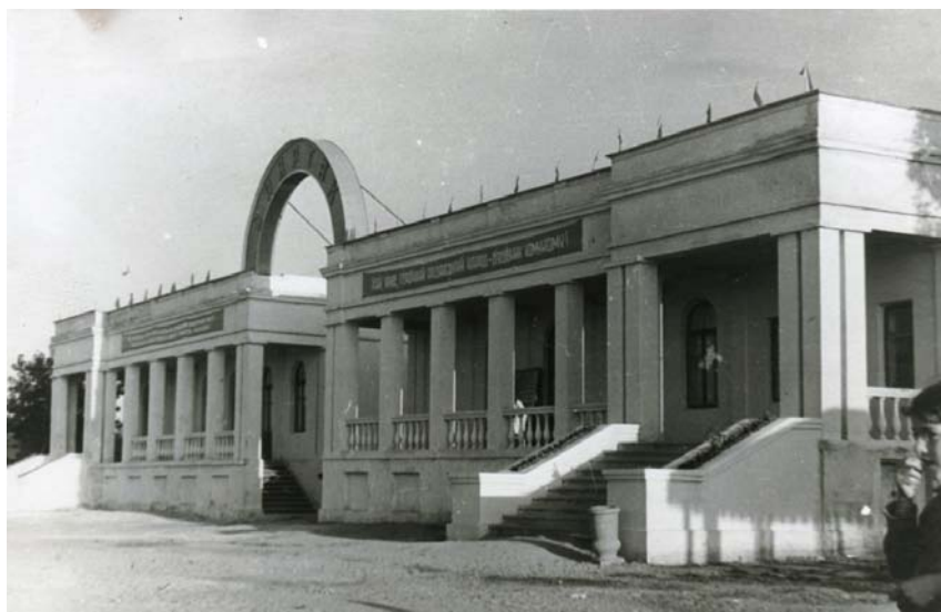
Водна станція, початок 1950-х рр.