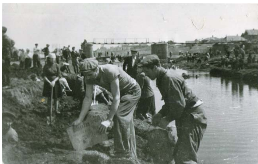
На будівництві водосховища, 1949-50 рр.