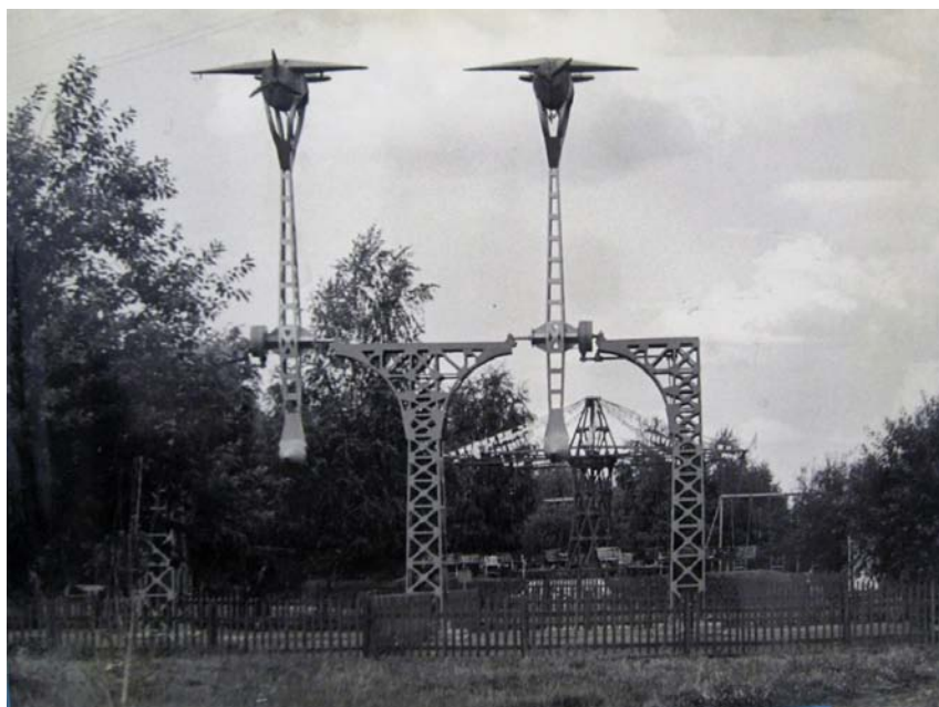
Один з перших атракціонів у парку – «Петля Нестерова», 1962 р.