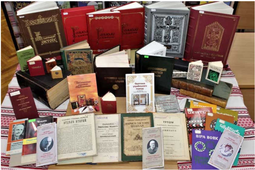
Бібліотечні раритети Хмельницької ОУНБ