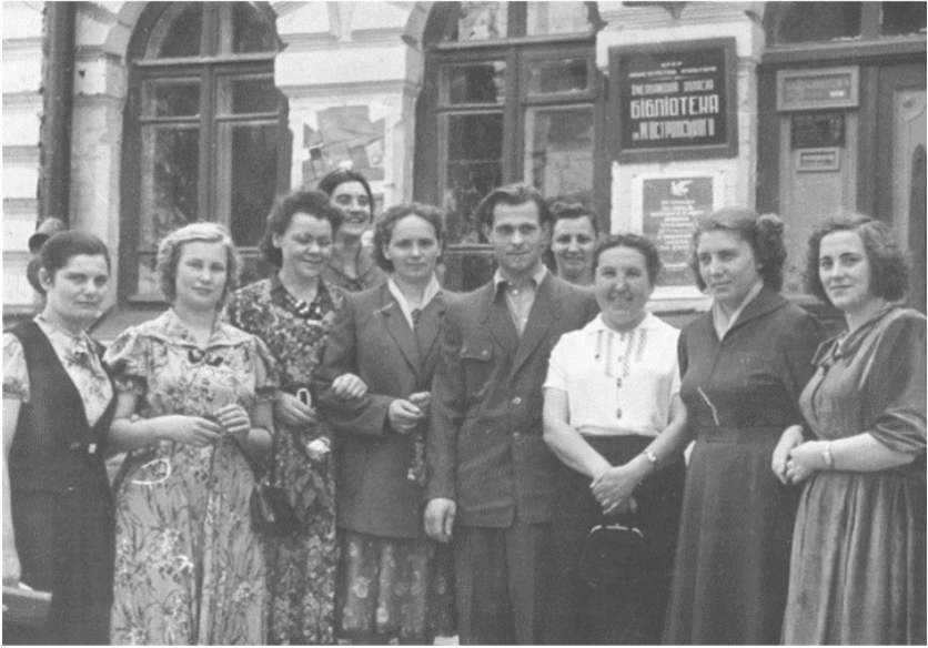
Колектив Хмельницької обласної бібліотеки. Кінець 50-х років.