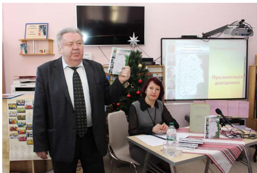
Презентація «Календаря знаменних і пам'ятних дат Хмельниччини» на 2020 рік.