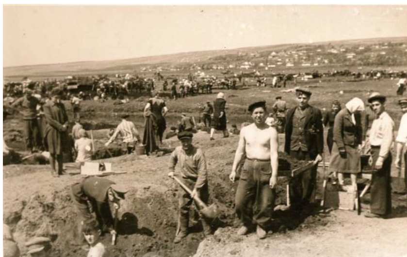
На будівництві водосховища, 1949-50 рр.