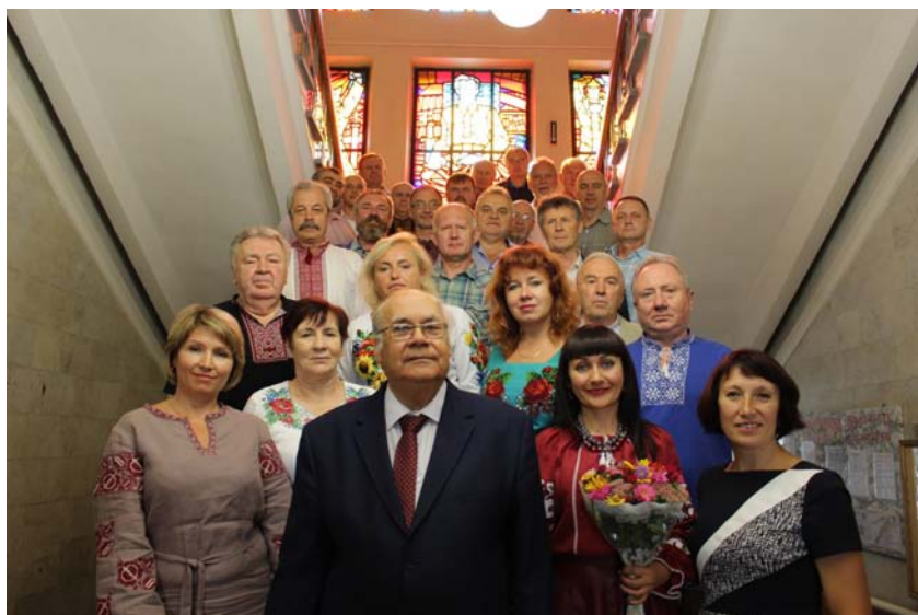
2018 рік. Учасники засідання клубу Краєзнавець Хмельницької обласної універсальної наукової бібліотеки