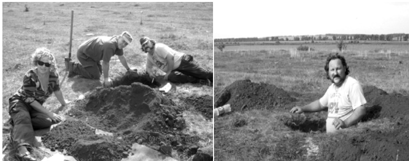
4. Лятка. 2017. Епізоди повторного дослідження могили.

Щорічної науково-практичної конференції Національного музею історії України. Текст доповіді буде опубліковано до кінця січня 2018 р. на сайті установи. Готується стаття для фахового журналу «Археологія». Зацікавилися знахідкою і археологи Московського державного університету, які запропонували опублікувати статтю про поховальні пам'ятки пшеворців на Хмельниччині у фаховому збірнику КСИА.