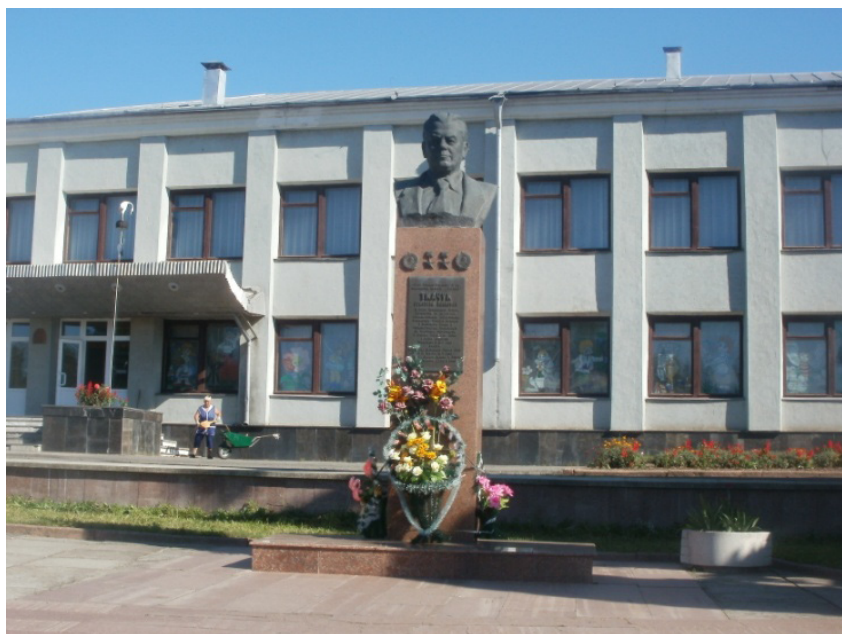
Село Лісоводи. Пам'ятник Г. Ткачуку