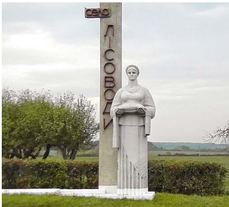
Ласкаво просимо у Лісоводи