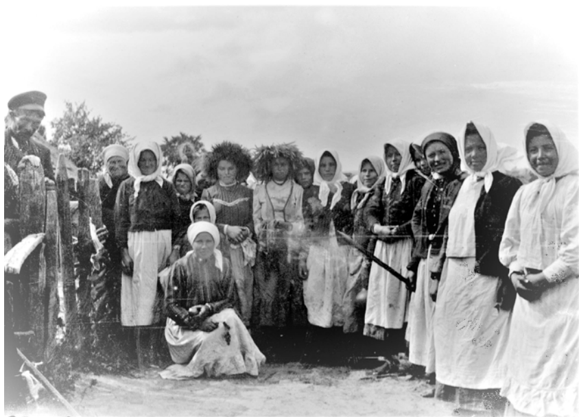
Селянки с. Колибань після польових работ, поч. XX ст.