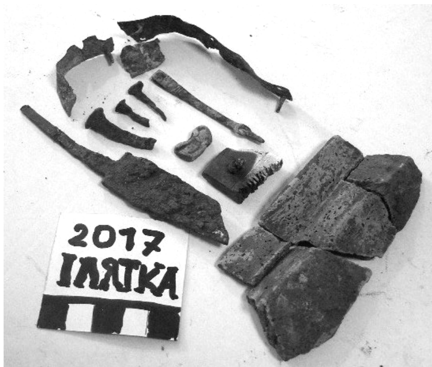
6. Лятка. 2017. Дрібні артефакти з пох. Пшеворської кул-ри.

Виявники розрівняли зігнутий відповідно до конкретного поховально-го ритуалу хвостовик ножика, на що вказує специфічно вищерблена іржа. Додаткове обстеження засипки могили не виявило верхній шматок клинка. Можливо, його і шматок меча, забрали учасники похорону як обереги у поході, а після повернення додому використовували на сільському святині.