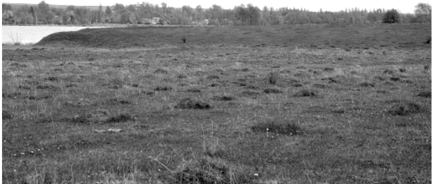
3. Мис, на якому виявлено пох. Пшеворської культури.

виявлено два цвяхи для кріплення умбона, а також набагато важливіші артефакти – фрагмент кістяного гребеня і заготовку на свинцеву пломбу.