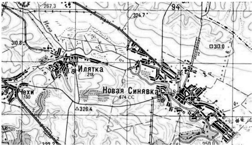
2. Ілятка. 2017. Місцезнаходження пох. Пшеворської к-ри.