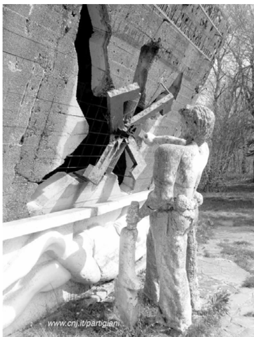
Пам'ятник іноземним партизанам в Емілії-Романьї