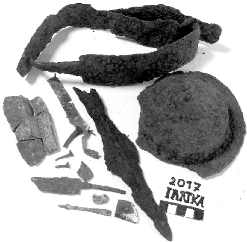
5. Ілятка. 2017. Артефакти з пох. Пшеворської кул-ри.

2. Залізний меч зберігся у двох фрагментах. Вкритий іржею. Частково піддався глибокій корозії. Місцями попований ударами лопати виявників.