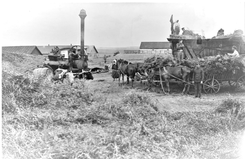
Копистинська ферма, поч. XX ст.