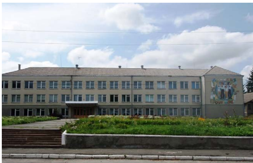
Село Лісоводи. Загальноосвітня школа. Фото 2014 р.