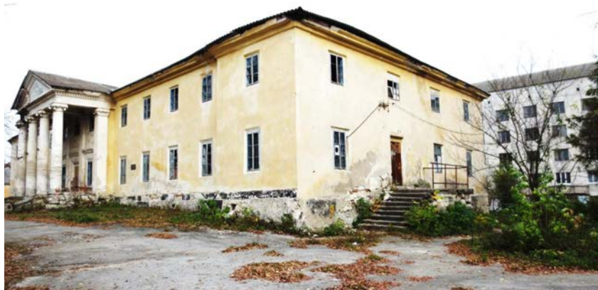
Село Лісоводи. Палац Раціборовських-Журовських. Фото 2015 р.