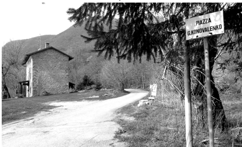
Пам'ятник розташований на площі, що носить ім'я загиблого українця – Григорія Коноваленка