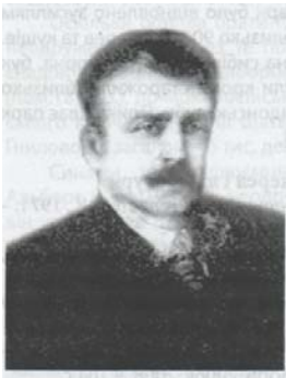
Журовський А.Є. (1869 – 1949).