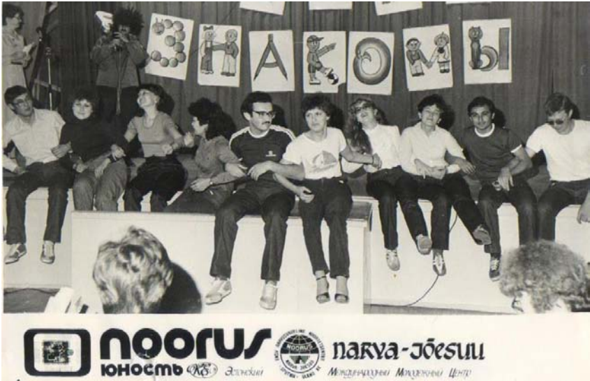
Єстонія. Міжнародний молодіжний центр Ноорус. 1984 р.