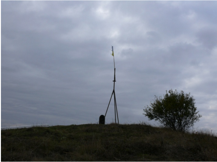
Геодезичний пункт Дуги Струве «Фельштин», Хмельницька обл., Хмельницький р-н, с. Гвардійське