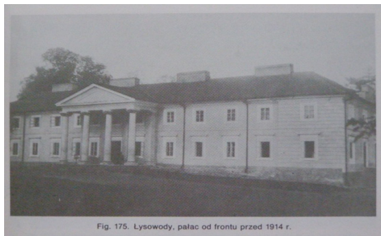
Fig. 175. Lysowody, pałac od frontu przed 1914 r.