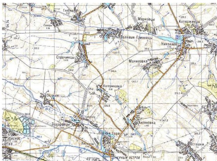
Позначення місця розташування Геодезичного пункту Дуги Струве «Катеринівка», на мапі Генерального штабу М 1:100000 (1987 р.)