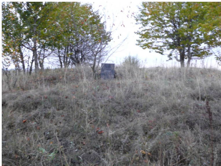
Геодезичний пункт Дуги Струве «Катеринівка», Хмельницька обл., Хмельницький р-н, с. Катеринівка.