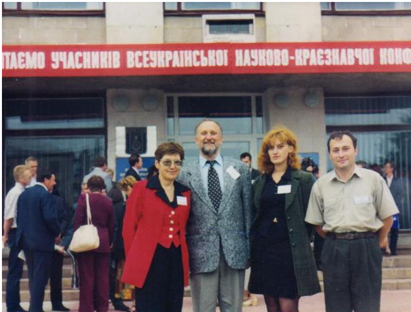
На науково-краєзнавчій конференції у Коростені, 2002 р.