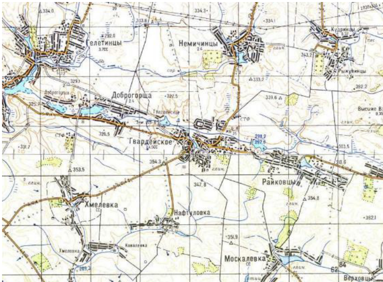
Позначення місця розташування Геодезичного пункту Дуги Струве «Фельштин», на мапі Генерального штабу М 1:100000 (1987 р.)