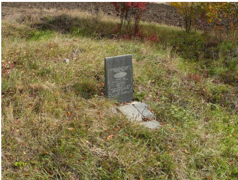
Геодезичний пункт Дуги Струве «Баранівка», Хмельницька обл., Ярмолинецький р-н, с. Баранівка.